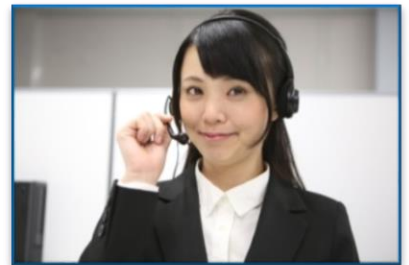
MultiKISコンタクトセンター